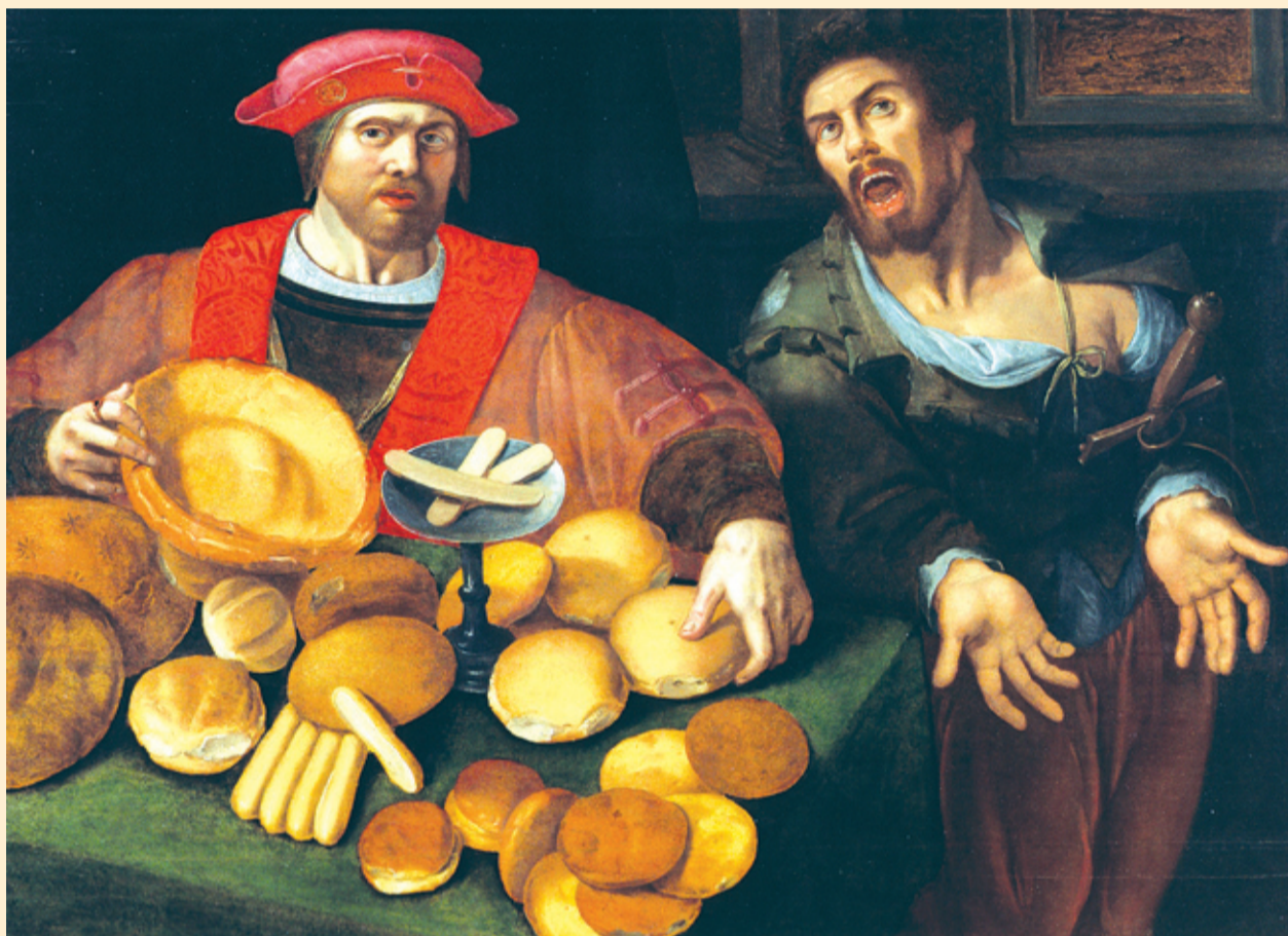
Ha az átlagot tekintjük, mindkettőnek tucatnyi kenyere van

A szerző véleménye nem tükrözi sem az OECD, sem a tagországok kormányainak álláspontját.